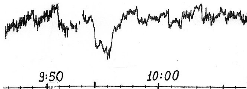
рис. 3. 08.06.2004. Заход Нептуна в 9:56.